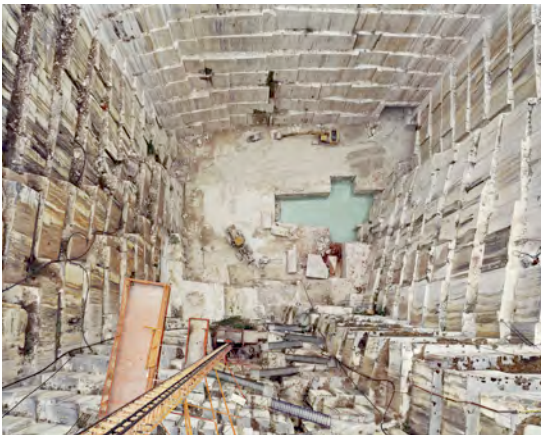
Edward Burtynsky, 'Iberia Quarries # 8, Cochicho Co., Pardais, Portugal', 2006, aus der Serie 'Quarries', C-Print, 121.9 x 152.4 cm