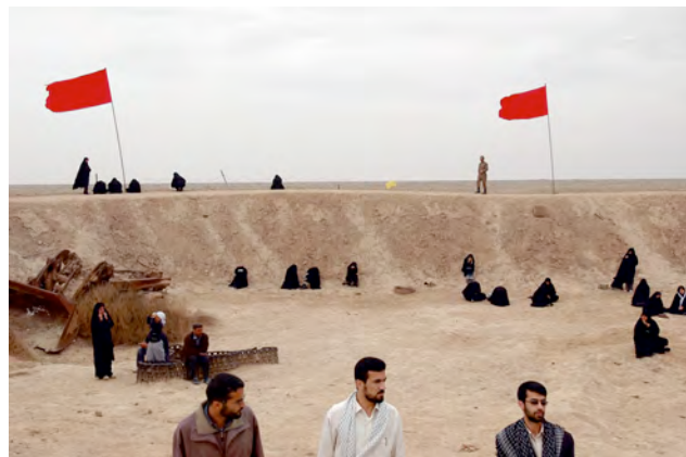
Abbas Kowsari, 'Shade of Earth', Talalye, Süd-Iran, 2007, Digital Chromogenic Colour Print, 70 x 105 cm © Abbas Kowsari © Prix Pictet Ltd 2009