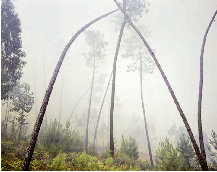
Edgar Martins, ohne Titel, Portugal, 2008, aus der Serie 'The Diminishing Present', C-Print, 98 x 127 cm © Edgar Martins © Prix Pictet Ltd 2009