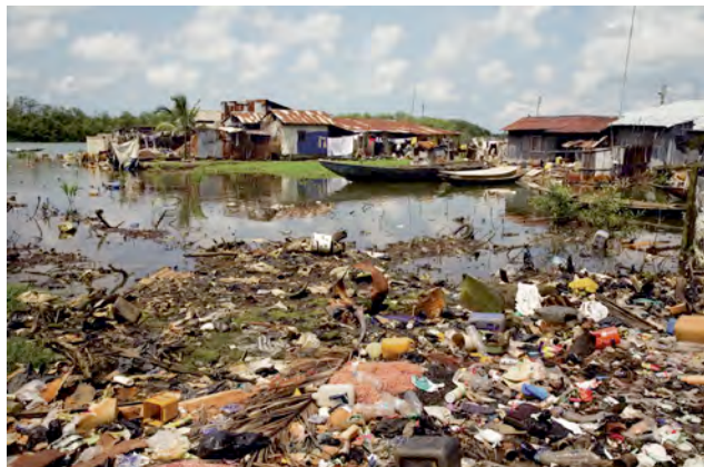
Ed Kashi, Nigeria, 2006, aus der Serie 'Curse of the Black Gold: 50 Years of Oil in the Niger Delta', Archival Inkjet, 40 x 50 cm © Ed Kashi © Prix Pictet Ltd 2009