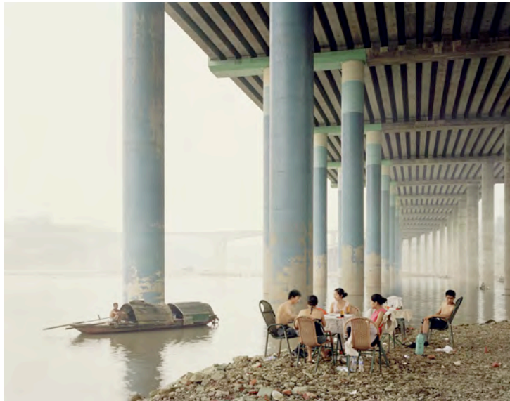
Nadav Kander, 'Chongqing IV (Sunday Picnic)', 2006 aus: 'Yangtze, The Long River Series', k.A. zur Größe

Für die Fotografieszene ist es immer hilfreich, wenn sich finanzkräftige Firmen und Organisatoren engagieren. Fotografen, Galerien, Veranstalter wie die Rencontres d'Arles oder Paris Photo profitieren davon. Wie wichtig eine Initiative wie Prix Pictet für die Fotografie sein wird, ob Impulse gesetzt werden können, bleibt abzuwarten. Die Bandbreite, Internationalität und Qualität der ausgewählten Arbeiten ist allemal beeindruckend. A.G. www.prixpictet.com