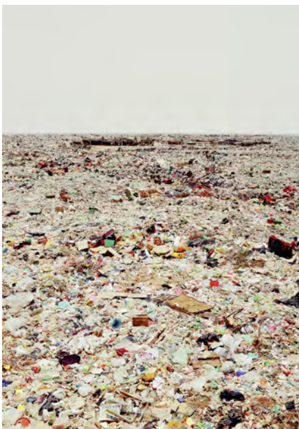
Andreas Gursky, ohne Titel, 2002, C-Print, 280 x 207 x 6,2 cm © Andreas Gursky, VG Bild-Kunst, Bonn